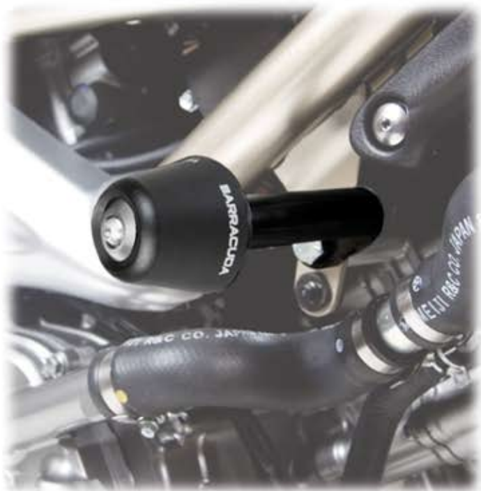
PUNTO DI ATTACCO AL TELAIO